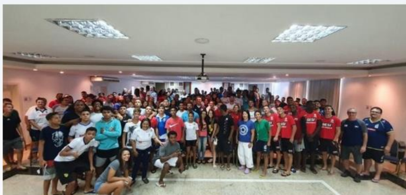
CBJ e COB realizaram palestra de prevenção contra o doping para os atletas das categorias de base presentes no Treinamento de Campo Sub-21, em Pindamonhangaba.