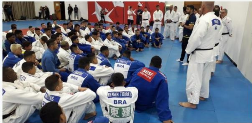
Judocas brasileiros realizam treinamento de campo com judocas argentinos e franceses, em Pindamonhangaba

Começou, no último domingo (19), o Treinamento de Campo Internacional Sub-21, promovido pela Conderação Brasileira de Judô, em Pindamonhangaba, no interior de São Paulo. O treinamento terá a duração de 13 dias e conta com 266 jovens atletas, entre eles 10 judocas da Argentina e 12 da França. A primeira semana contará apenas com a presença dos atletas brasileiros da categoria júnior que, em seguida, ganharão a companhia de atletas da classe sênior.