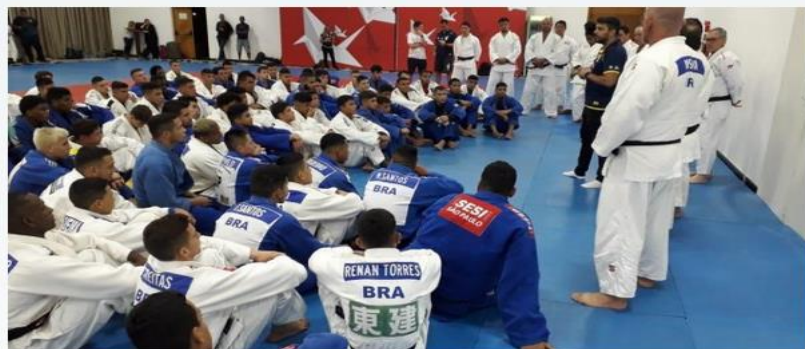
Judocas brasileiros realizam treinamento de campo com judocas argentinos e franceses, em Pindamonhangaba

Começou, no último domingo (19), o Treinamento de Campo Internacional Sub-21, promovido pela Condição Brasileira de Judô, em Pindamonhangaba, no interior de São Paulo. O treinamento terá a duração de 13 dias e conta com 266 jovens atletas, entre eles 10 judocas da Argentina e 12 da França. A primeira semana contará apenas com a presença dos atletas brasileiros da categoria júnior que, em seguida, ganharão a companhia de atletas da classe sênior.