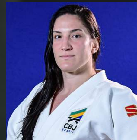
MAYRA AGUIAR MEIO-PESADO (-78KG)