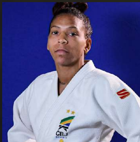
RAFAELA SILVA LEVE (-57KG)