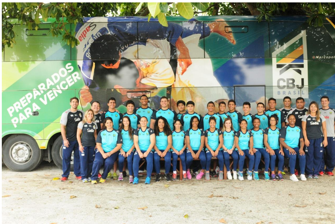
Treinamento de campo Internacional Saquarema/RJ

As ações previstas acima só serão realizadas caso a Confederação Brasileira de Judô consiga aprovar e captar os recursos através da Lei de Incentivo.