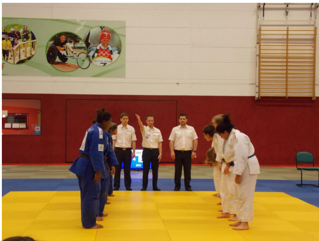
Desafio por equipes em Bad Blankenburg/GER