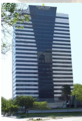
Hotel Golden Túlip - Oficial