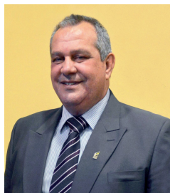
Sílvio Acácio Borges Presidente Confederação Brasileira de Judô

Conto com o apoio de todos e desejo muito sucesso nesta nossa caminhada que se inicia agora.