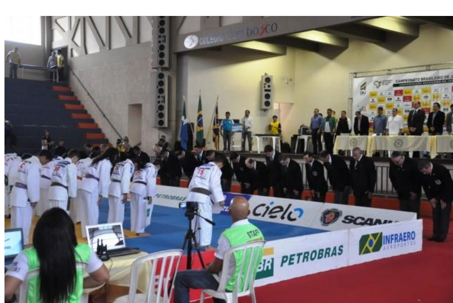
Abertura do Brasileiro Sub18 – Campo Grande/MS