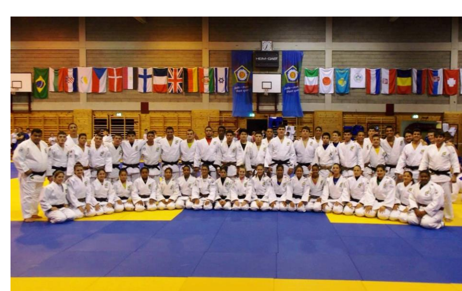
Delegação Sub21 – Leibnitz/AUT - 2015