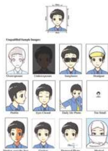
IJF ID Card Picture - Rules